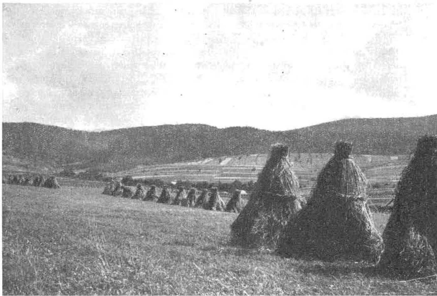
Obr. 2. Snopy v panákokoch. Loka, okr. Námestovo. Archív NÚ SAV, i. č. 8766. Foto J. Podolák, 1957.