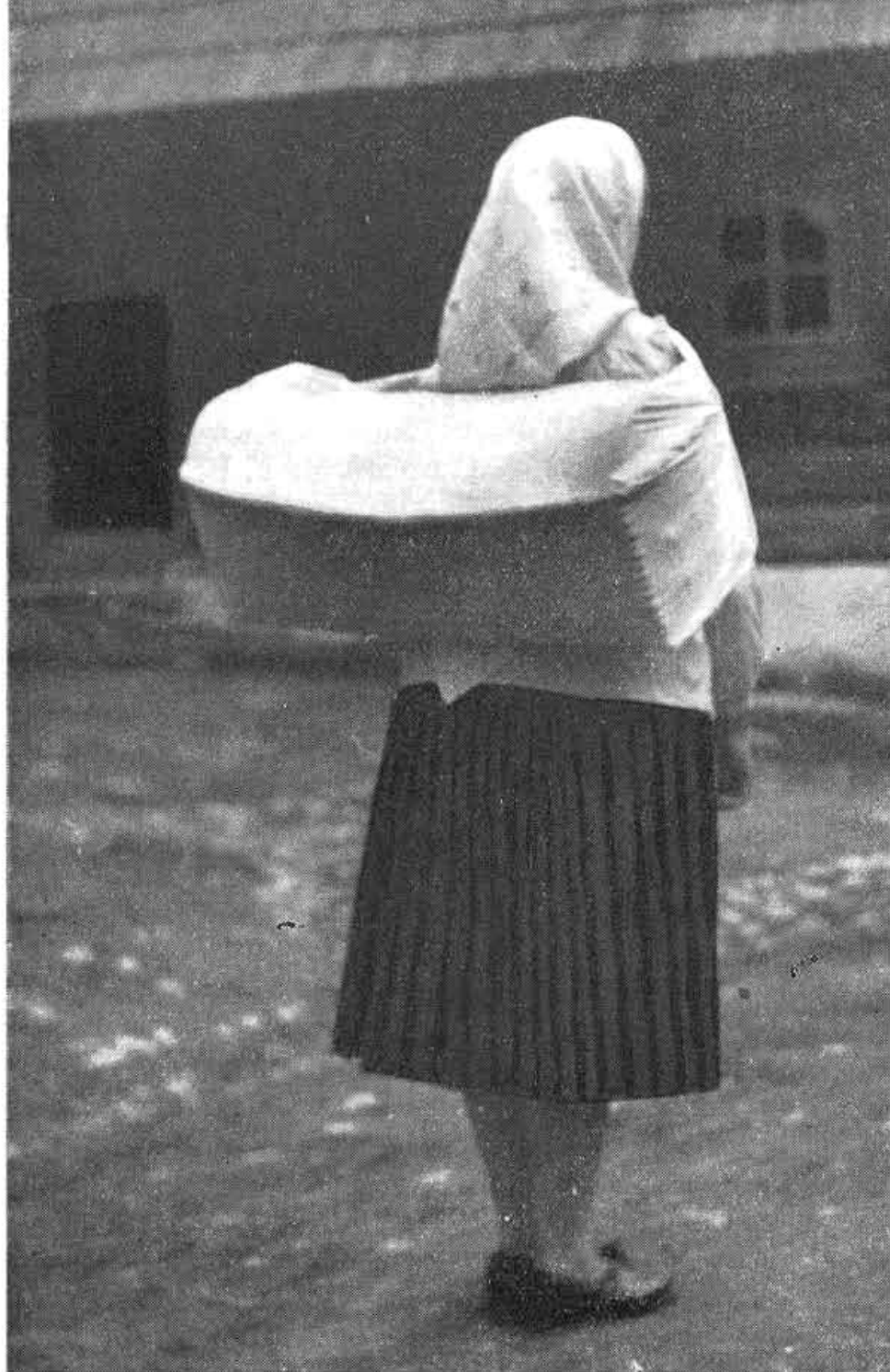
Obr. 3. Nosenie detí v koši, Podbiel, okr. Trstená. Archív NÚ SAV, i. č. 6868. Fo- to S. Kovačevičová, 1954.

rokov nášho storočia a doznieva v ojedinelých prípadoch až po obdobie vyrubovania kontingentov. 32