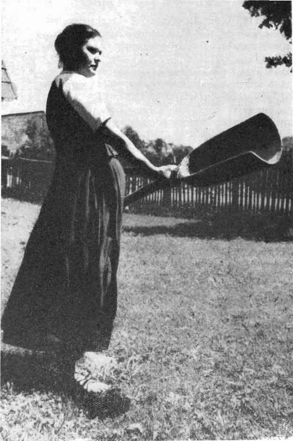
Obr. 1. Žena s ve- jačkou. Lokca, okr. Námestovo. Archív NÚ SAV, i. č. 161. Foto K. Chotek, NS čs.

veľký, ako sa ukazuje zo spôsobu, akým sa vybavovalo vydanie spisu, ako aj z jedného Revického výroku v priebehu vybavovania. Spis bol r. 1868 zaslaný na Ministerstvo poľnohospodárstva, odkiaľ bol konečne po troch rokoch (1871) vrátený a schválený. Revický potom odovzdal rukopis predsedovi Gazdovského spolku, ktorý na porade roku 1874 — čiže o ďalšie tri roky — rozhodol rukopis vydať v 1400 exemplároch. Po ďalších poradách a schvaľovaniach sa rukopis r. 1875 odovzdal do tlače a o rok nato vychádza. 21