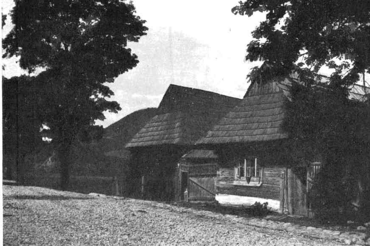
Obr. 4. Zrubový dom v Podbieli, okr. Trstená. Archív NÚ SAV, i. č. 6895. Foto S. Kovačevičová, 1954.

Život drevorubačov v lesoch, ich prácu a zárobok opisuje pomerne podrobne J. Nagy, ktorý hovorí aj o zaujímavom systéme svojpomoci u lesných robotníkov — o určitej forme poistného. Pri väčších podnikoch sa robotníkom strhávala z platu určitá časť na krytie výdavkov na lekára a lieky, na vyplatenie náhrady za poškodený voz, alebo za úraz, ktorý sa pri práci stal koňovi. Peniaze, ktoré sa za pracovnú sezónu nevyčerpali, dostala škola v tej obci, z ktorej bolo najviac robotníkov. 51